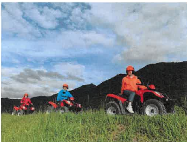
夏の京北はまるで北海道！クワッドバギーツアー