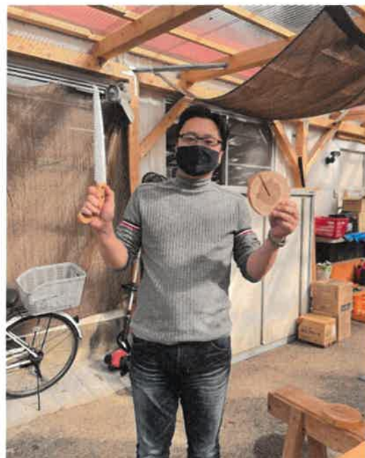
本職と丸太切り対決！