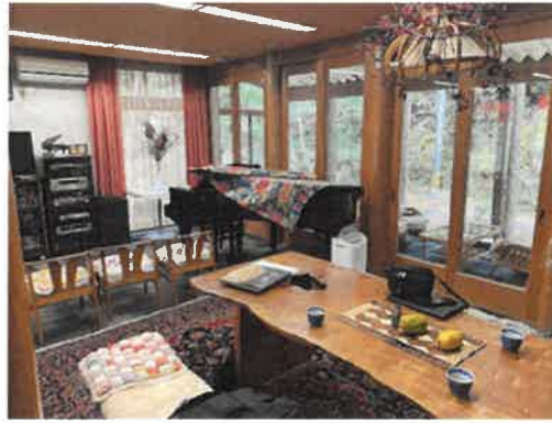
時には音楽を聴きながら食事を