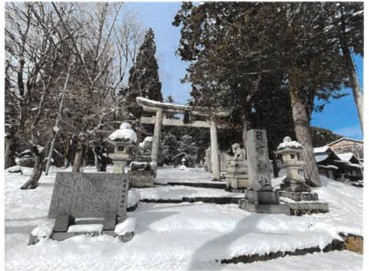
一番鳥居前イメージ