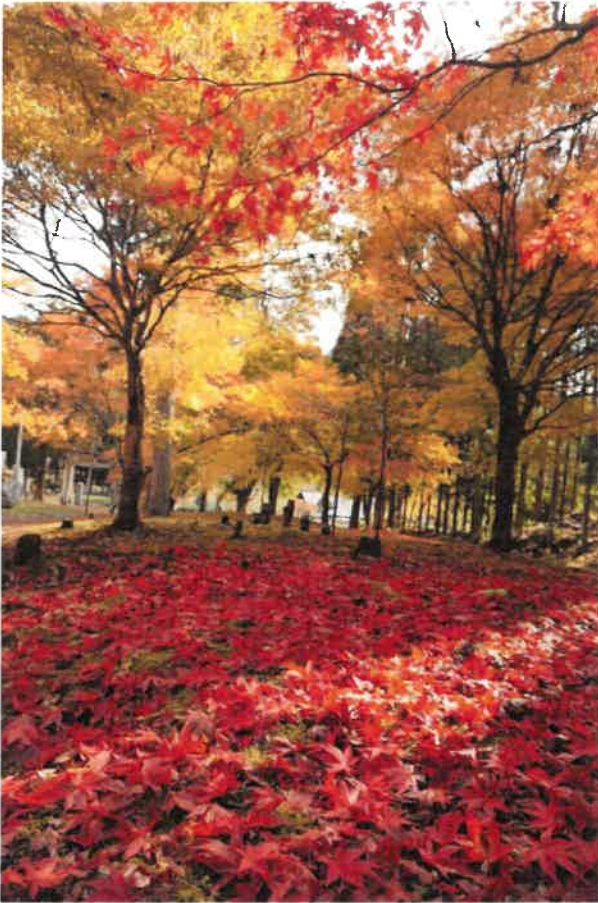
境内の紅葉イメージ