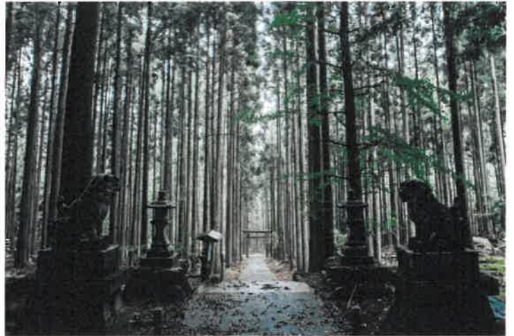
本殿からの眺めはとても神秘的