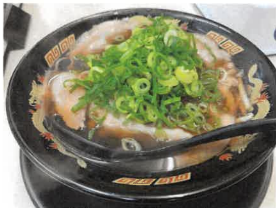
名物のイノシシラーメン