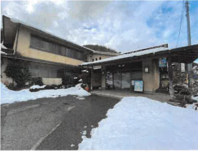
旅館玄関イメージ