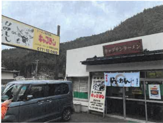
京北の玄関口、細野地区にあるラーメン屋