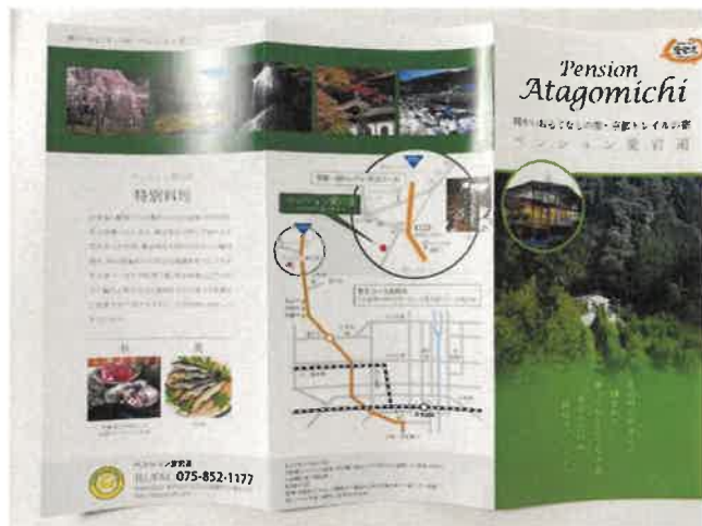
お宿のパンフレット