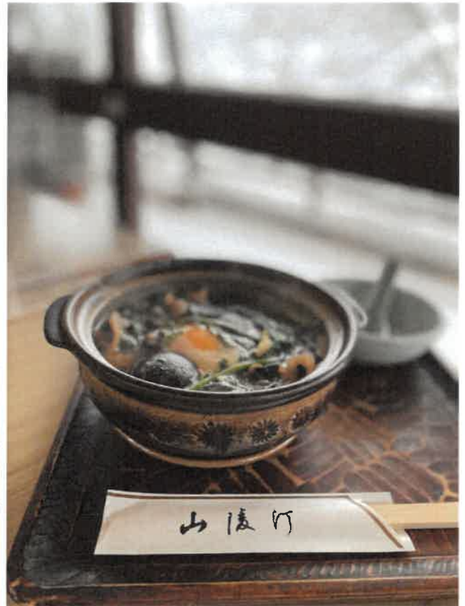
牡丹鍋（一人前）イメージ