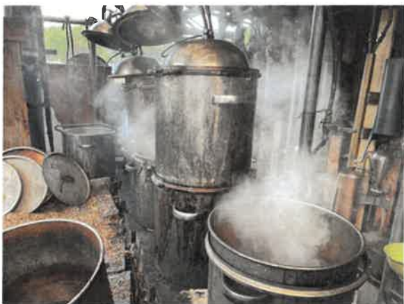
ご主人手作りのアロマオイル精油器具