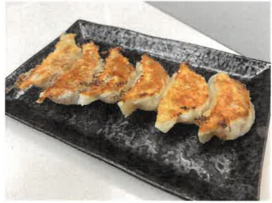
これもまた名物 いの鹿餃子