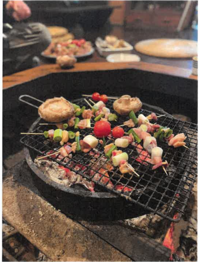
地鶏の囲炉裏炭火焼イメージ