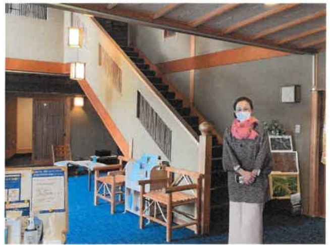
フロントロビー・女将さん