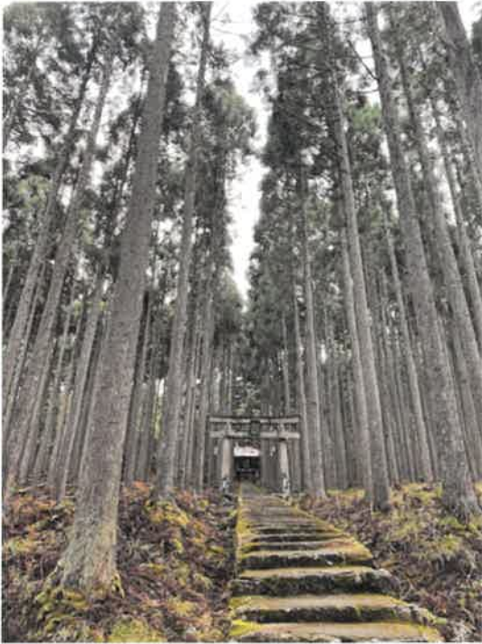
一の鳥居から本殿を