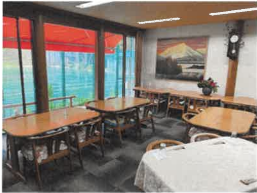
清潔に保たれた食堂