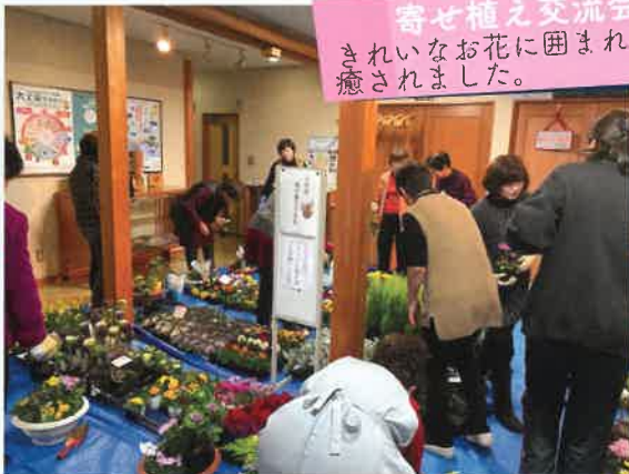
寄せ植え交流会 きれいなお花に囲まれて気持ちも癒されました。