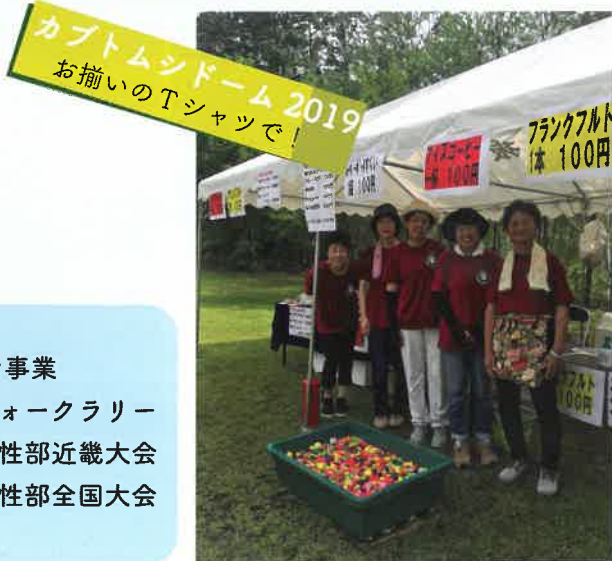
カブトムシドーム2019 お揃いのTシャツで!