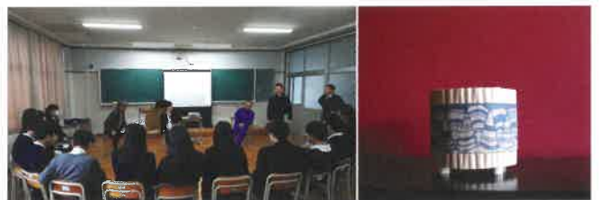
北桑田高校アントレプレナーシップ授業

商工会青年部では三年前から事業の一環として北桑田高校へアントレプレナーシップ（未来の人材育成を通して授業を行う）に行っています。今年度は生徒と商品開発の試作を通して実際に商品販売までの工程と一緒に学んでいきます。生徒だけでなく青年部員もより一層の知識が必要となり共に成長しています。新たな取り組みで失敗もある時もありますが、その失敗を糧に成長・成功できるようにワクワクしながら授業をしています。