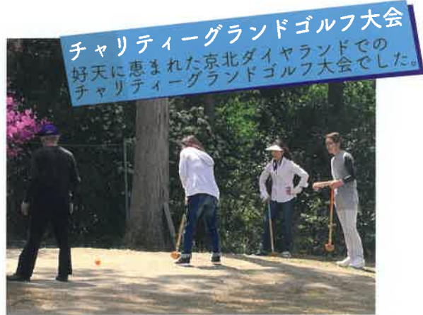
チャリティーグランドゴルフ大会 好天に恵まれた京北ダイヤモンドでのチャリティーグランドゴルフ大会でした。