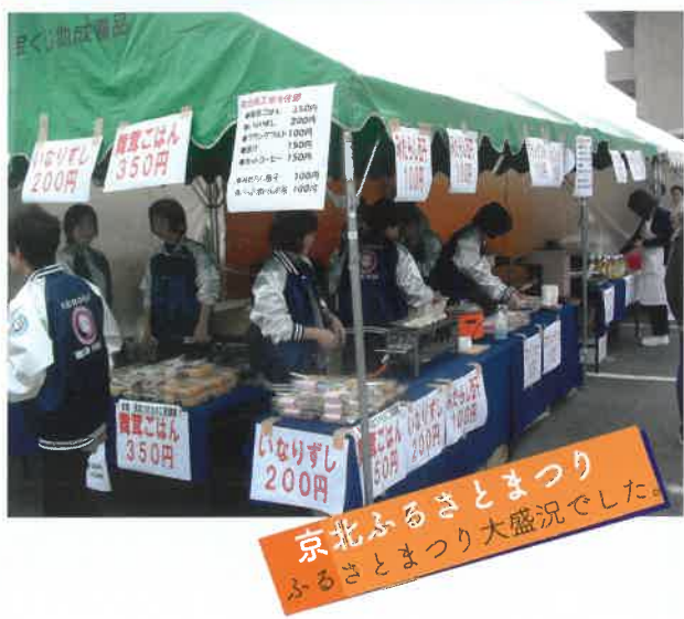
京北ふるさとまつり ふるさとまつり大盛況でした。