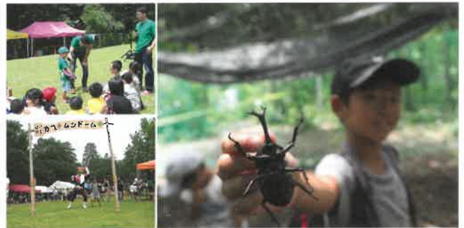
森のカブトムシドーム 2019

7月には通算14回目となる『森のカブトムシドーム2019』を無事開催できました。約170組のお客さんファミリーにお越しいただき盛況でした！森の中でカブトムシを捕まえよう！という子どものためのイベントです。本物の木からカブトムシをとることが初めての子供さんが多く、親も子供も大変喜んでいただきました。子どもたちを応援するため仮面ライダーが駆けつけてくれたり、会員の皆さんにも協力していただき、子供の夏休みの記憶にも残ったことと思います。ありがとうございました。