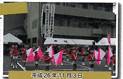
平成26年11月3日 「ふるさとまつり2014」 オープニング演奏(カラーガードを入れて)