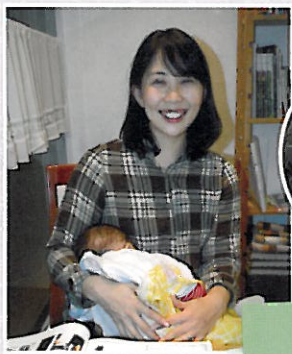
右京区京北周山町西丁田 21-3 TEL / 075-585-4040