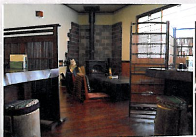
右京区京北周山町東丁田 13-3 TEL / 075-852-1680