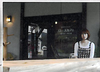
右京区京北下弓削町勝山 11 番地 TEL / 075-854-1068