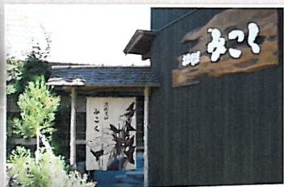
右京区京北上黒田町川間 12 番地 TEL / 075-856-0608

一昨年、11月23日に古民家を改修し開店し、やっと一年を迎えようとしています。京北そばみこくです。