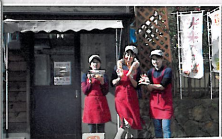
右京区京北下弓削町狭間谷 4-48 TEL / 080-1478-4178

平成 23 年よりウッディー京北さんに委託・販売をさせてもらっています。皆さんの励ましや、うれしい感想に支えてもらって、ここまで来られました。