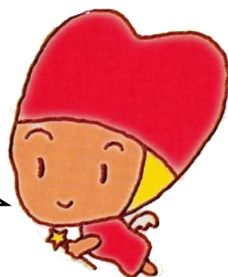
ほくほくカード会 キャラクター 「ほくちゃん」

新ポイントカードは小売業やサービス業だけでなくすべての業種の方を対象に加盟していただきたいと思っています。 地域の事業所同志のつながりを大切にするための団体として活動していけたらと考えます。 共に楽しく活動しましょう！